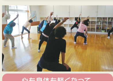
心も身体も軽くなって、 元気に帰って来られるよう お手伝いします！