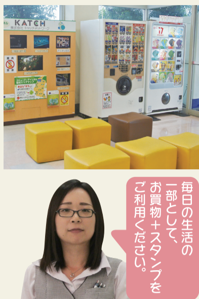
毎日の生活の一部として、 お買物+スタンプまで ご利用ください。