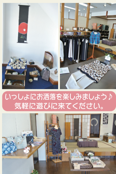
いっしょにお洒落を楽しみましょう！ 気軽に遊びに来てください。